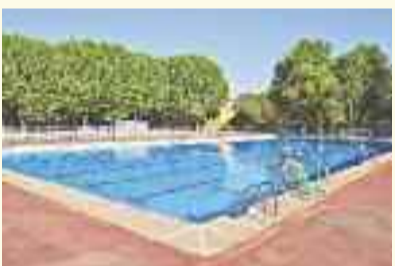
Las piscinas de verano abren sus puertas con novedades para la temporada 2024