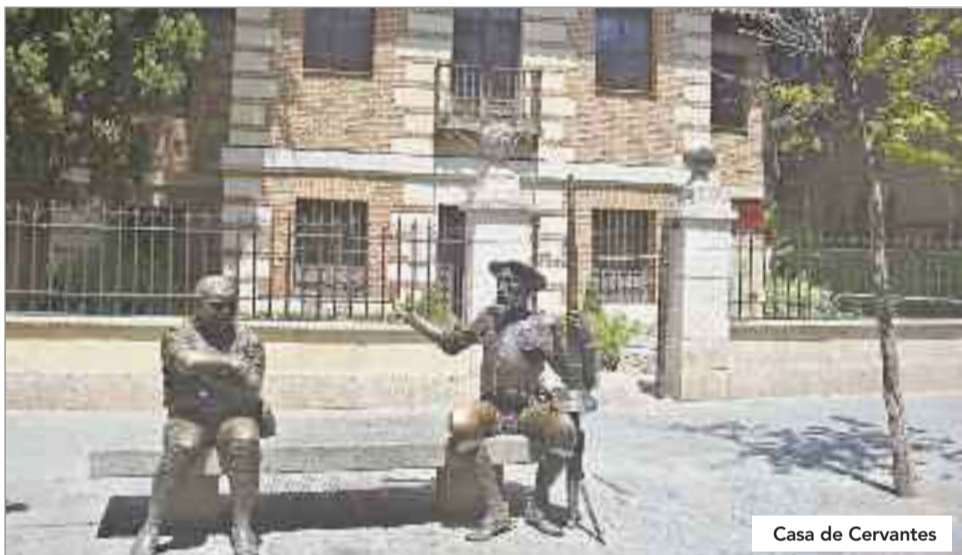
Casa de Cervantes

La lección que dio la Sociedad de Condueños en 1850 (y sigue dando hoy) fue magistral en todo Occidente, antes de que existieran la National Trust en Gran Bretaña (1895), El Fondo ambiente Italiano (FAI, 1975), etc., pues supuso que todo un pueblo (ricos y pobres, cultos e, incluso analfabetos), tomaran conciencia de la identidad de un pueblo como Alcalá y defendieran con sus medios la conservación de su patrimonio ejemplificado en el edificio del colegio de San Ildefonso y la manzana cisneriana. Es un supuesto único que ahora se distribuye por el mundo con el término inglés de crowdfunding, aunque no es igual, pues esto significa que se reúnen pequeñas aportaciones económicas de diversos lugares para conservar el patrimonio, mientras que aquí fueron los alcalaínos