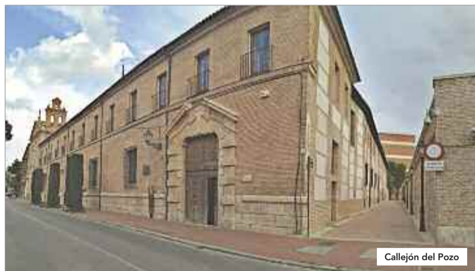
Callejón del Pozo

Aunque se ha hecho una labor increíble que admira a propios y ajenos, a título personal puedo indicar que hay muchos retos por delante, por ejemplo, eliminar