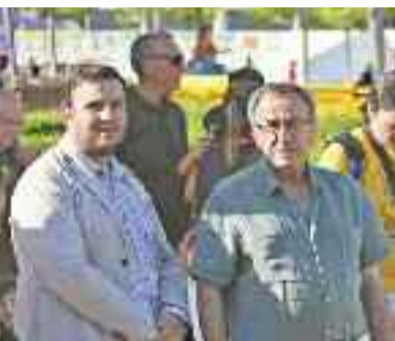
Alcalá de Henares celebró las 'Fiestas del Distrito IV'