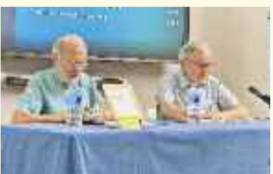
Presentación del Libro Lo que el Quijote no cuenta