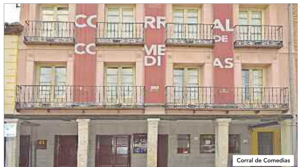
Corral de Comedias