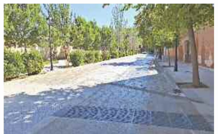
Se abrió al tráfico la calle Sandoval y Rojas y la Plaza de Palacio