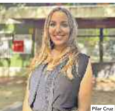
El 17 de junio, se abren las inscripciones para una nueva edición de VacAcciones