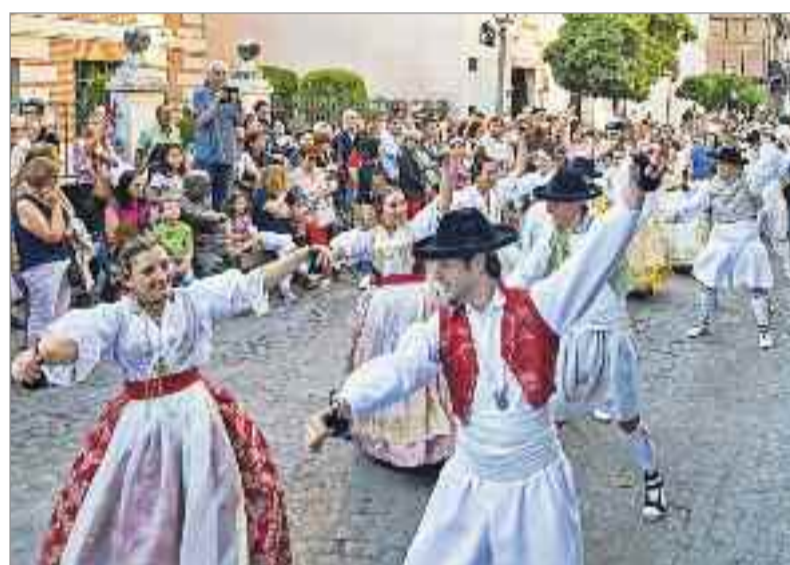
Un año más los jóvenes y la música y el teatro fueron los protagonistas de la Muestra