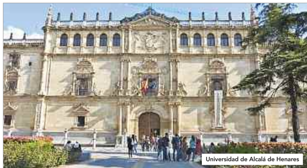
Universidad de Alcalá de Henares

Hoy nuestra ley de mecenazgo permite en muchos casos recuperar de desgravaciones de hacienda hasta el 80 % de lo aportado por personas privadas.