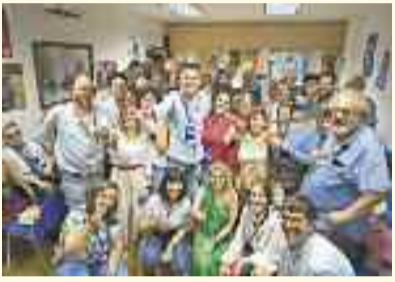
El PP ganó las Elecciones Europeas en Alcalá