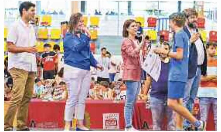
El Pabellón del Complejo Deportivo Espartales acogió la Clausura del Deporte Escolar Municipal 2023/24"